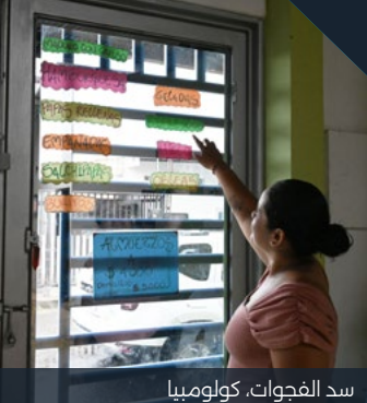
سد الفجوات، كولومبيا

للحصول على معلومات حول مجموعة أعمال بلومونت الكاملة في عام 2023، يرجى زيارة www.blumont.org