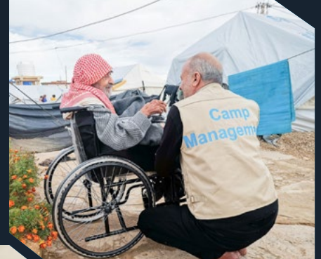
شمال شرق سوريا، SAFER III