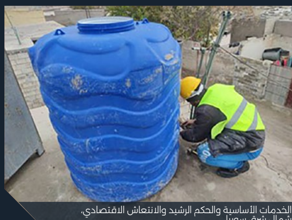
الخدمات الأساسية والحكم الرشيد والانتعاش الاقتصادي، شمال شرق سوريا