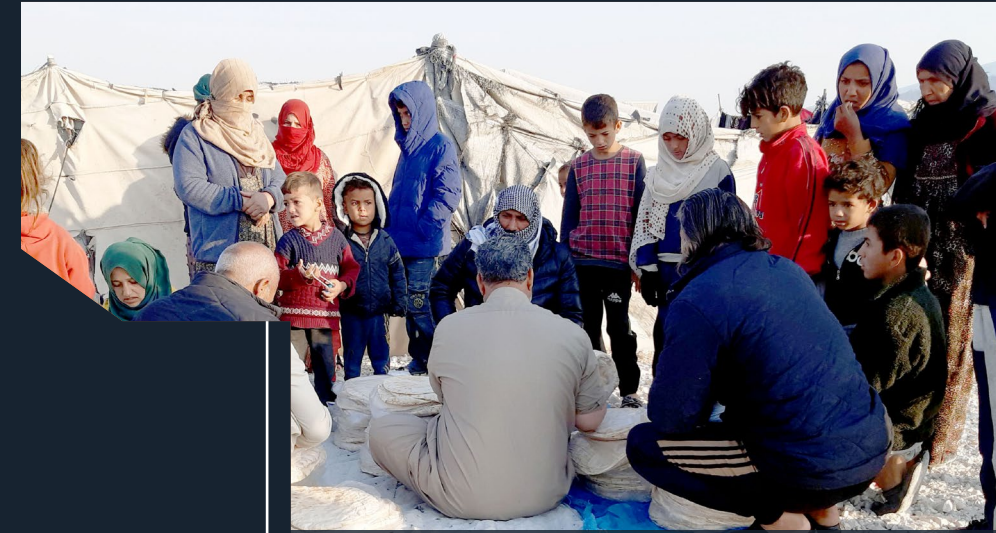
Gestion des conflits et stabilisation dans les camps d'Al-Hol et de Roj, dans le Nord-est de la Syrie

962m 3 d'eau potable distribués quotidiennement dans le nord-est de la Syrie