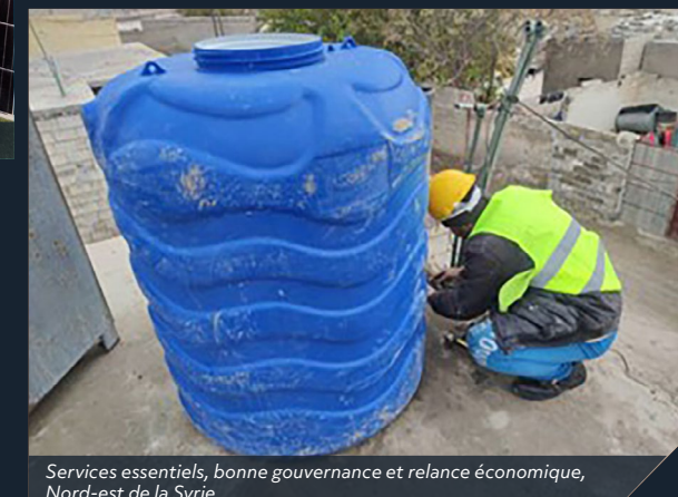
Services essentiels, bonne gouvernance et relance économique, Nord-est de la Syrie