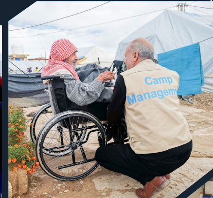
SAFER III, Nord-est de la Syrie

1,01 million d'articles distribués dans le cadre de tous les programmes de Blumont