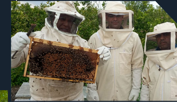
Désert Intelligent, Jordanie