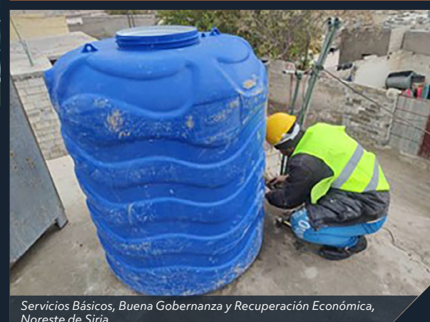
Servicios Básicos, Buena Gobernanza y Recuperación Económica, Noreste de Siria