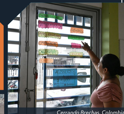
Cerrando Brechas, Colombia

Tanto los colombianos desplazados como los migrantes venezolanos están obteniendo mejores viviendas mientras encuentran estabilidad y comunidad a través de nuestros programas. Seis a nueve meses de apoyo de arriendo, en combinación con servicios de apoyo por niveles, están cimentando el camino para lograr la autosuficiencia de familias.