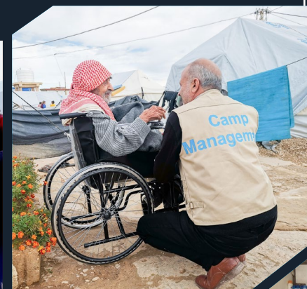
SAFER III, Noreste de Siria