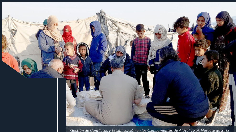
Gestión de Conflictos y Estabilización en los Campamentos de Al Hol y Roj, Noreste de Siria

962m 3 de agua potable distribuidos diariamente en el noreste de Siria